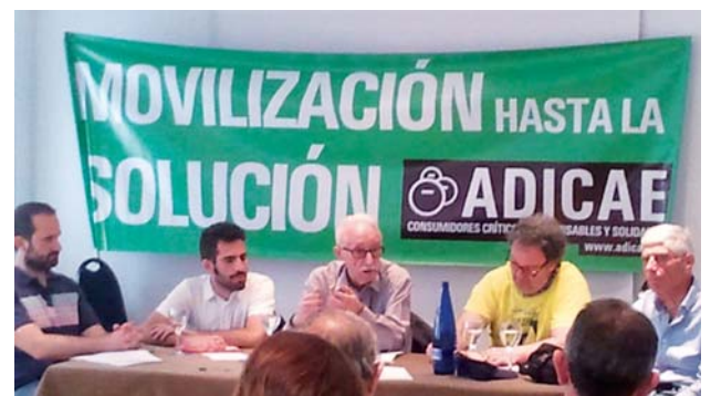
Reunión de la Coordinadora Estatal de Comités de ADICAE, 10 de mayo 2014, Madrid.

Además de este acto multitudinario en Madrid, se han ido desarrollando una serie de actuaciones para impulsar las propuestas de solución planteadas. Así, el viernes 9 de mayo, un grupo de afectados pertenecientes a ADICAE y la Federación de Clientes de Afinsa y Fórum Filatélico entregaron en Presidencia del Gobierno, en Moncloa, un escrito reclamando la implementación de esta propuesta de solución que ya han apoyado por unanimidad un total de seis parlamentos autonómicos, ayuntamientos e instituciones de todo signo político.