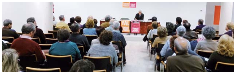
Comité de Afectados de Alcorcón (Comunidad Madrid), febrero 2014.

El 10 de mayo, tras la celebración de la manifestación estatal en Madrid, se realizó una reunión de la Coordinadora Estatal de Comités de la Plataforma de Afectados por Fórum, Afinsa, AyN de ADICAE. En la misma se apostó por varias cuestiones: movilización permanente, seguir consiguiendo apoyos institucionales, redoblar la recogida de firmas, apostar por la unidad, reactivar la estrategia judicial, etc. También se fijó la movilización para el sábado día 21 de junio para actuaciones en toda España que mantengan activa la reivindicación.