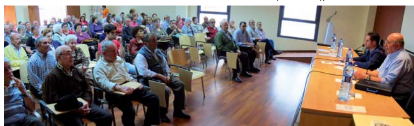
Asamblea Unitaria en Pedro Muñoz (Ciudad Real), 15 abril 2014.